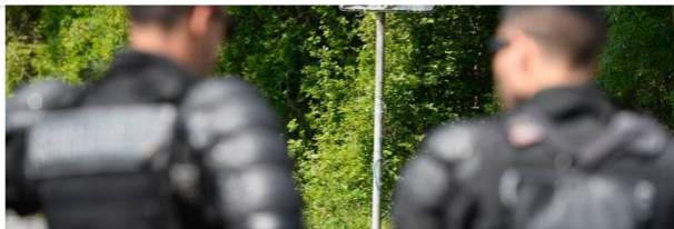
Une deuxième opération d'expulsions doit démarrer jeudi 17 mai sur la Zad de Notre-dame-des-Landes.