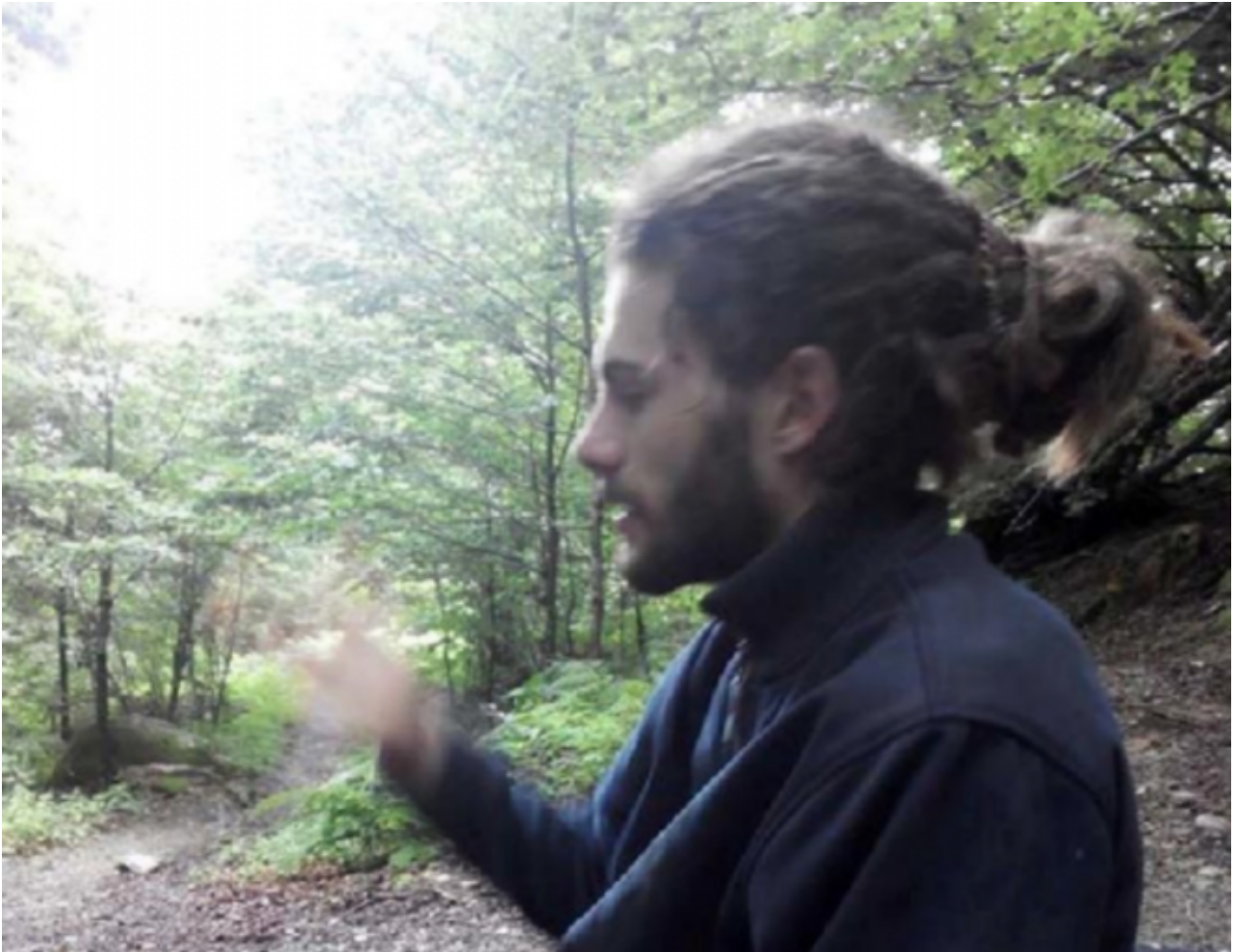
Rémi Fraisse

points de celles des gendarmes mobiles qui étaient sur le site de Sivens cette nuit-là. Chacun de ces nouveaux témoins était, en effet, présent dans la zone d'affrontements au moment où Rémi Fraisse a été tué. Certains disent avoir tout vu, d'autres non, mais chacun a précisé sa position cette nuit-là sur un croquis remis aux juges.