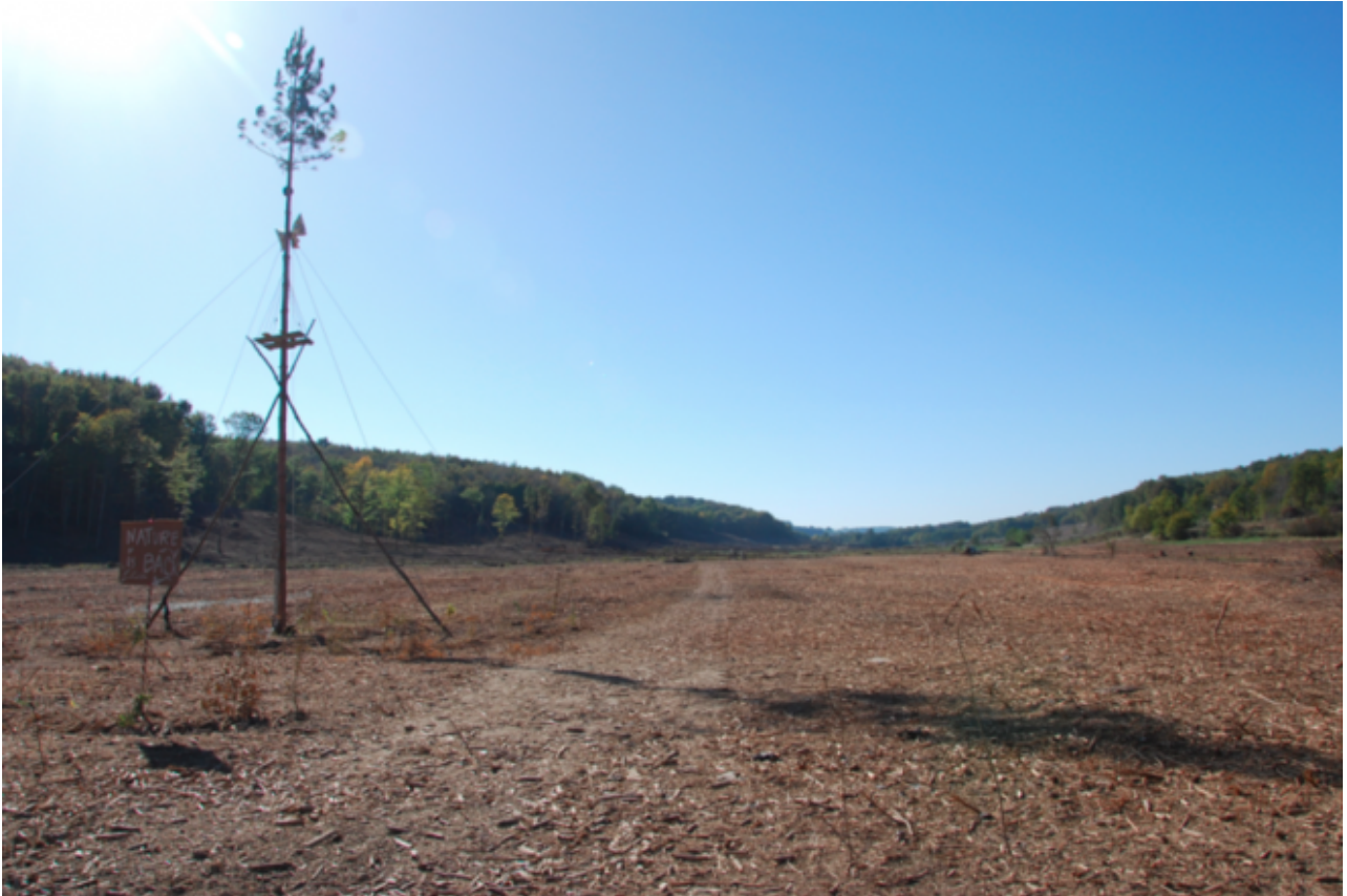
La zone déboisée de Sivens

Une réunion avait été organisée le 21 octobre 2014 à la préfecture pour préparer le rassemblement festif du 25, où plusieurs milliers de personnes étaient attendues. Les questions de circulation et de stationnement des véhicules ont pris du temps, selon le compte-rendu auquel Mediapart a eu accès. Mais la prise en compte des risques d'incident aussi.