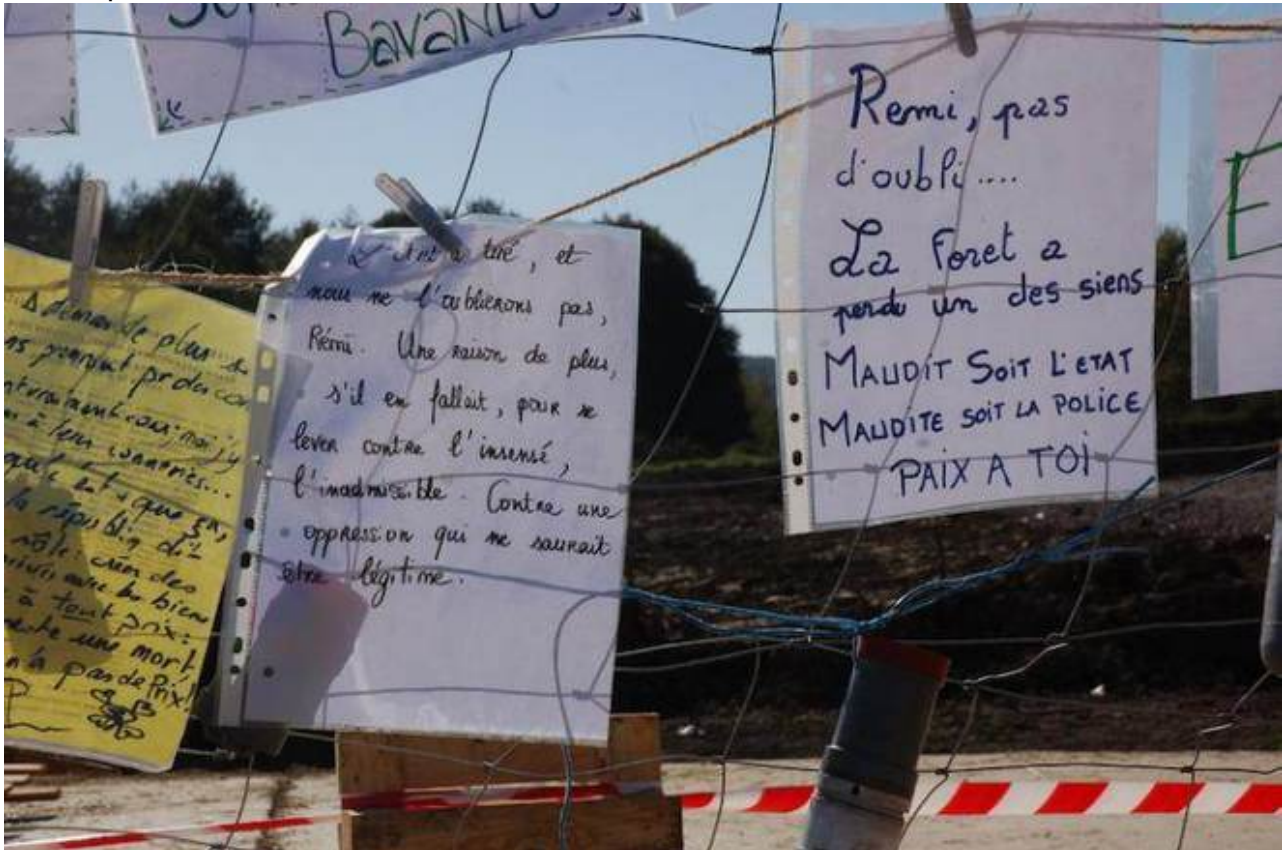
Un autel à la mémoire de Rémi Fraise

De nouveaux témoins, interrogés récemment par les juges d'instruction, décrivent l'attitude pacifique de Rémi Fraise lors des affrontements de Sivens, et mettent en cause le comportement des gendarmes mobiles la nuit où le jeune homme a été tué.